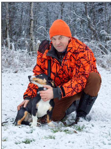
Vapaa-aikaan kuuluu metsällä kulke- mista Kerttu-koiran kanssa.